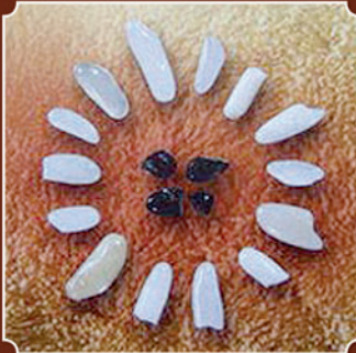
สิ้นฐาน ดุจเมล็ดข้าวสารหัก