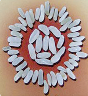
สิ้นฐาน ดุจเมล็ดข้าวสาร