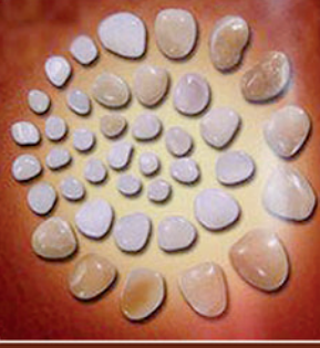
สิ้นฐาน ดุจเมล็ดถั่วแตก

พระบรมสารีริกธาตุ คือ พระอัฐิธาตุของ องค์สมเด็จพระสัมมาสัมพุทธเจ้า จะแตกต่างกันจากอัฐิของพระอริยสาวกและบุคคลทั่วไป มี ๓ ขนาด คือ