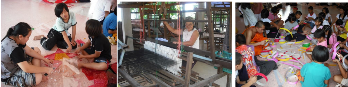
กิจกรรมสืบสานประเพณี วัฒนธรรม ภูมิปัญญาของท้องถิ่น