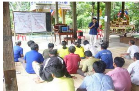
กิจกรรมจัดทำแผนชุมชน