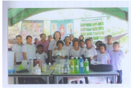
กิจกรรมทำน้ำหมักชีวภาพ/น้ำยาสมุนไพร