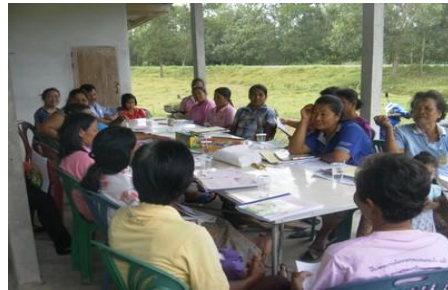
การทำบัญชีครัวเรือน