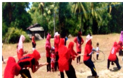
กิจกรรมส่งเสริมสุขภาพ