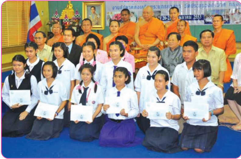
พระพรหมวชิรญาณ ประธานฝ่ายสงฆ์ มอบทุนการศึกษา พร้อมเกียรติบัตรแก่ผู้ชนะเลิศรอบชิงชนะเลิศระดับประเทศ